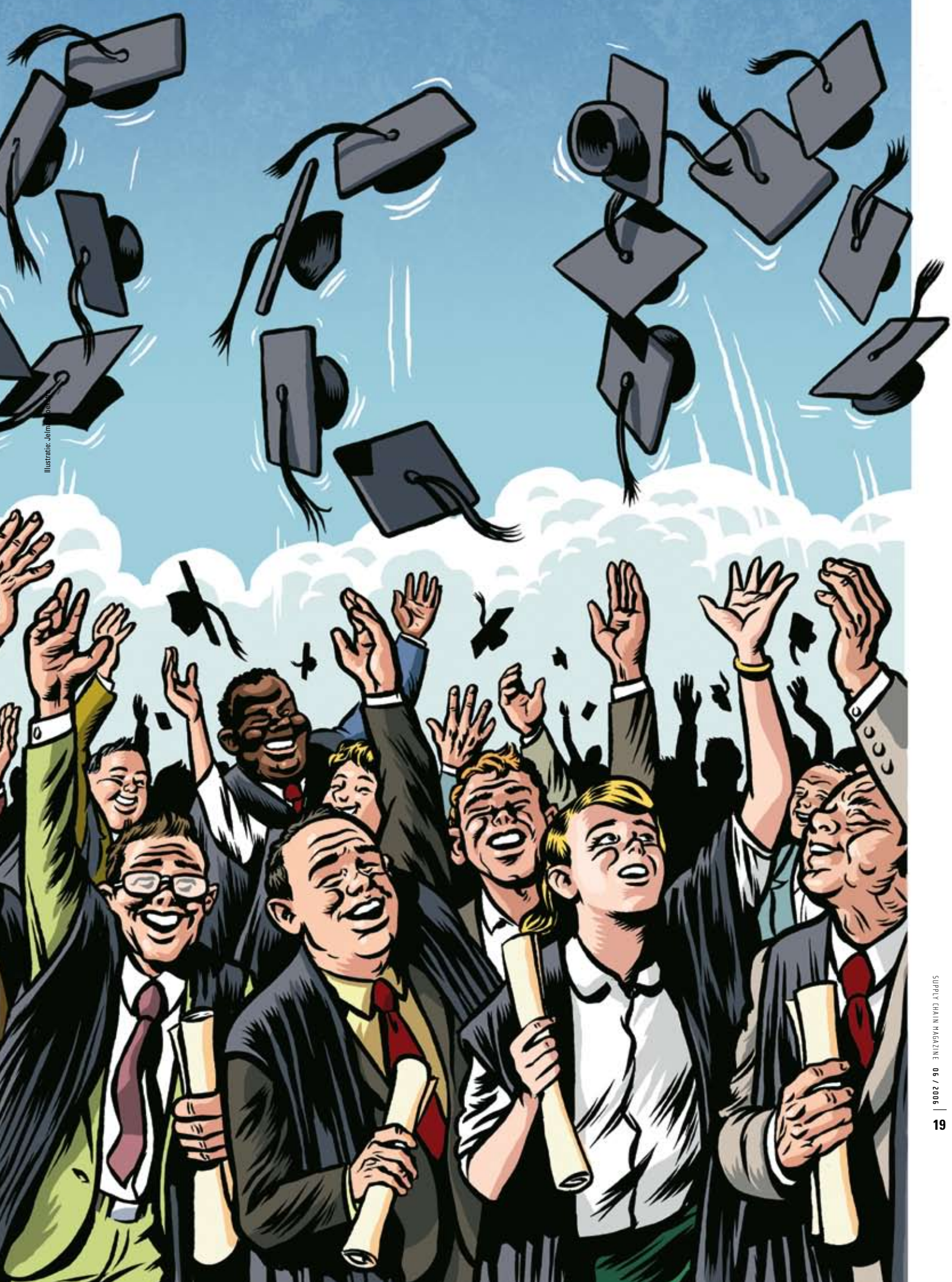
Illustration: John ...