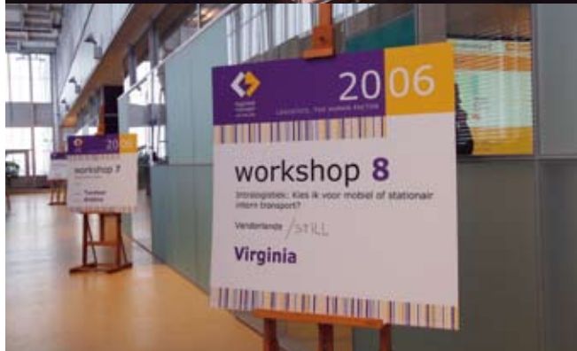
De workshops vormden een belangrijk onderdeel van het programma van de Verkiezing Logistiek Manager van het Jaar