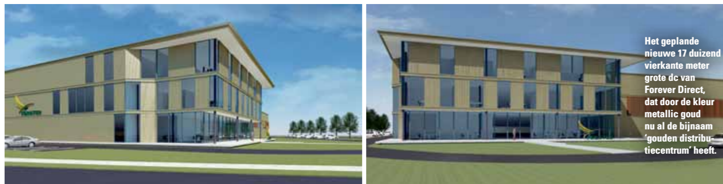
Het geplande nieuwe 17 duizend vierkante meter grote dc van Forever Direct, dat door de kleur metallic goud nu al de bijnaam 'gouden distributiecentrum' heeft.

HVBM ontwikkelt mindmap voor advies logistiek vastgoed