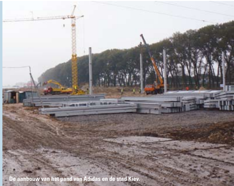
De aanbouw van het pand van Adidas en de stad Kiev.

Immo Industry Group bouwt in opdracht van sportmerk Adidas en bandenproducent Nokian Tyres nieuwe nationale distributiecentra in Kiev. De Belgische vastgoedontwikkelaar nam Supply Chain Magazine mee voor een sitebezoek en naar de opening van een eigen nieuwe vestiging in Kiev.