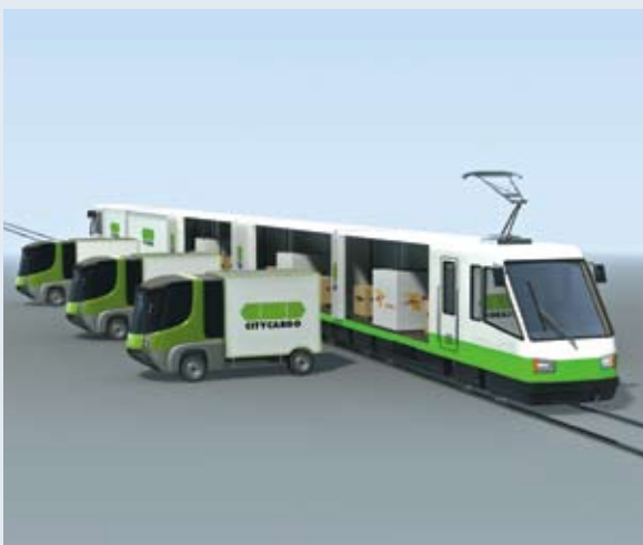
Vrachtram moet eind maken aan lange rijen vrachtwagens in Amsterdam.

CityCargo Amsterdam heeft twee crossdockcenters buiten de stad waar de goederen in de tram worden geladen. Deze trams rijden naar binnenstedelijke overslagplaatsen, zogenoemde hubs, waar de goederen in elektrisch aangedreven vrachtwagens worden geladen, die zorgen voor de fijndistributie naar de afleveradressen. Vaanhold geeft toe dat dit de rijen niet direct korter maakt. 'Maar het is wel een heel stuk goedkoper', beweert hij. Inmiddels hebben meerdere steden, waaronder Utrecht, interesse getoond in het concept.