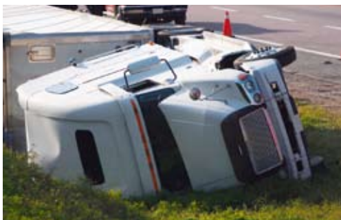
Schadepreventietrainingen moeten aantal schades verminderen.

www.deltalloyd.nl/transportverzekeringen