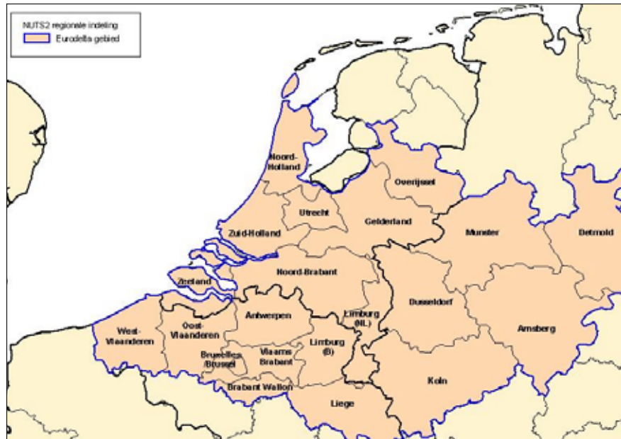
Nederland, Vlaanderen en de regio rond het Ruhrgebied vormen in omvang de derde economie ter wereld, aldus het rapport 'Samenwerken in de Eurodelta' van de Raad voor Verkeer en Waterstaat.