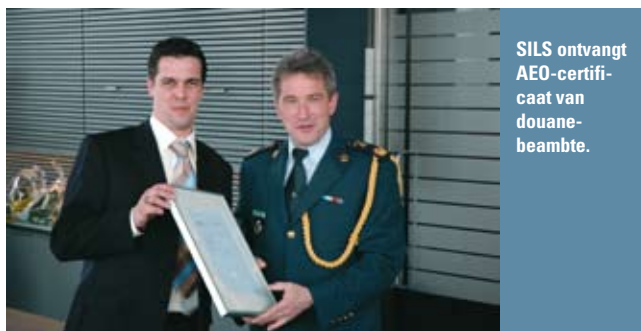
SILS ontvangt AEO-certificaat van douanebeambte.

► Maar liefst negentien Nederlandse bedrijven ontvingen in april het AEO-certificaat. Tot de trotse bezitters horen MOL Logistics, Van den Meerendonk en SILS. De overige bedrijven maakten zichzelf niet bekend aan Supply Chain Magazine. Het was de eerste uitreiking sinds de invoering van dit systeem.