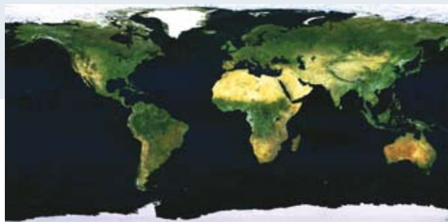
Groene wetgeving is volgens professor Larry Lapide één van de zes macrofactoren die 2020 beïnvloeden.

Daarna definieerden ze zes macrofactoren die invloed uitoefenen op de wereld zoals die er over tien tot vijftien jaar uit zal zien. Iedereen weet dat de vergrijzing intreedt in de ontwikkelde landen en dat er een tekort aan blauwe boorden ontstaat. Arbeiders in warehouses en productiebedrijven zullen ouder worden en daardoor vaker zowel mentale als fysieke beperkingen zullen hebben. Het ligt in de lijn der verwachting dat bedrijven meer zullen