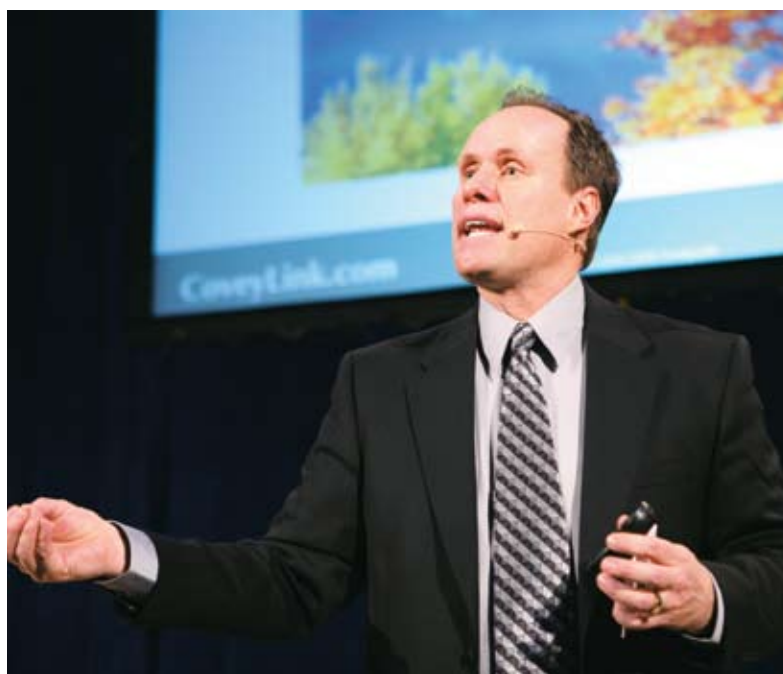
Stephen M.R. Covey: 'Mensen niet vertrouwen is riskanter dan het wel te doen.'

Op de vraag wat hij van netwerktools als LinkedIn vindt, antwoordt hij. 'Ik ken het wel. Ik geloof zelfs dat ze het woord ver-