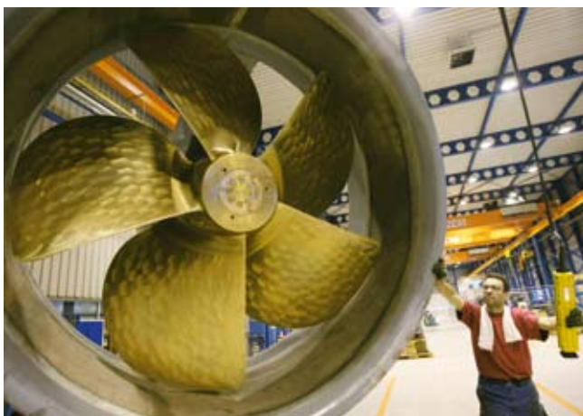
De truster-hal van Wärtsilä.

Het derde agendapunt is de beschikbaarheid van vakkundig personeel. De CEO is vastberaden de banen in de maritieme sector te behouden. 'De maatschappij functioneert niet als er geen inkomen is. Het onze verantwoordelijkheid om op een concurrerende en winstgevende manier banen te creëren. Het is wishful thinking dat we alles hier kunnen doen.' Wärtsilä beschikt in Azië daarom ook over een aantal fabrieken die kwalitatief even goede producten maken.