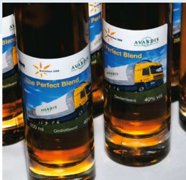
'The Perfect Blend', een voor de gelegenheid ontwikkelde likeur die symbool stond voor de samenwerking tussen de ketenpartners.

Avandis besloot vier jaar geleden de logistiek uit te besteden aan Van Uden Logistics, destijds via het pand in Waddinxveen. Al snel werd duidelijk dat een distributiecentrum op het terrein van Avandis grote voordelen kon opleveren, zowel qua efficiëntie als qua kostenbeheersing. In 2005 is de ontwikkeling van dit concept gestart en in juli 2007 is het pand operationeel in gebruik genomen. Binnen de nieuwe samenwerking is rekening gehouden met groei. Nieuwe opdrachtgevers kunnen bij